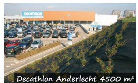
Decathlon Anderlecht 4500 m 2