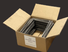
Hook 100 st.