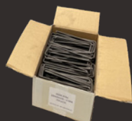
Hook Xtra 150 st.